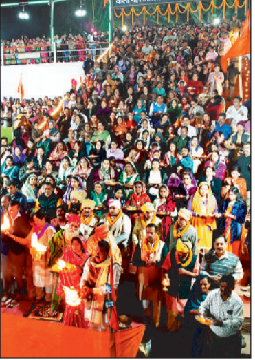
हरिभूमि न्यूज ►► रायगढ़

मं केलो भी उस वक्त प्रफुल्लित हुई जब केलो की कलकल ध्वनि के बीच पूरे वातावरण में 11 पंडितों के मंत्रोच्चार गुंजायमान हुआ। यह नजारा देखते बना रहा था जब मंत्रोच्चार के साथ एक साथ सैकड़ों हाथों ने मां केलो की आरती उतारी और उसे बचाने का संकल्प लिया। इस नजारे के सैकड़ों साक्षी बने।