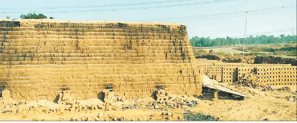
गमला ईट भट्टा में बनाए गए ईट।

रामानुजनगर क्षेत्र के ग्रामीण क्षेत्रों के गांव में नियम को ताक पर रखकर अवैध तरीके से गमला ईट भट्टा का धड़ल्ले से संचालित की जा रही है। इन क्षेत्र में ईट बनाने के लिए अवैध रूप से मिट्टी की खुदाई की जाती है जिससे राजस्व को अनावश्यक हानि होती है। हेरानी की बात यह है कि इन क्षेत्रों में कई जगह गमला ईट भट्टा का संचालन कई वर्ष से हो रहा है परंतु जांच व कार्रवाई के नाम पर आज तक सिर्फ खानापूर्ति ही की गई है। हालांकि कुछ लोग अपनी जरूरत व नए मकान निर्माण के लिए गमला ईट भट्टा लगाते हैं। परंतु अधिकांश लोग ऐसे हैं जो इनके आद में अवैध रूप से गमला ईट को व्यवसाय बना लिए हैं और